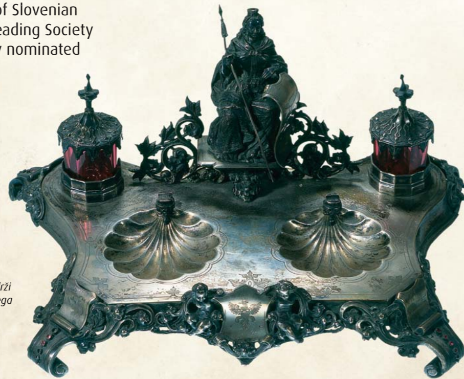
Tintnik, v sredini pesonifikacija Slovenije, ki drži v levici ščit z napisom: V spomin dvajsetletnega uredovanja "Novic" Slovenci na Kranjskem dr. Janezu Bleiweisu 5. Julija 1863