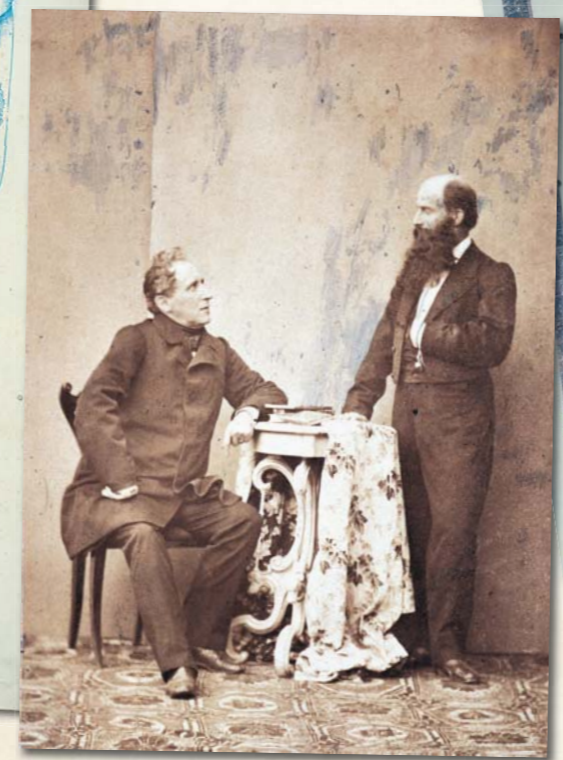
Dr. Janez Bleiweis in dr. Lovro Toman - slovenski politik in pesnik, poročen s pesnico Josipino Turnograjsko. Fotografija je nastala okoli leta 1860.