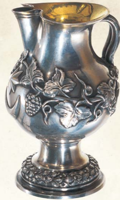
Bokal, napis na podstavku: "Gospodu dr. Janezu Bleiweisu iz priznanja zaslug za slovenski narod hvaležni štajerski Slovenci, 1861", pod ročajem napis: "Le primi jo za roče, Naj teče dokler hoče"

Janez Bleiweiss was president of Slovenian Literary Society and National Reading Society of Ljubljana. He was deservedly nominated "father of Slovenian nation".